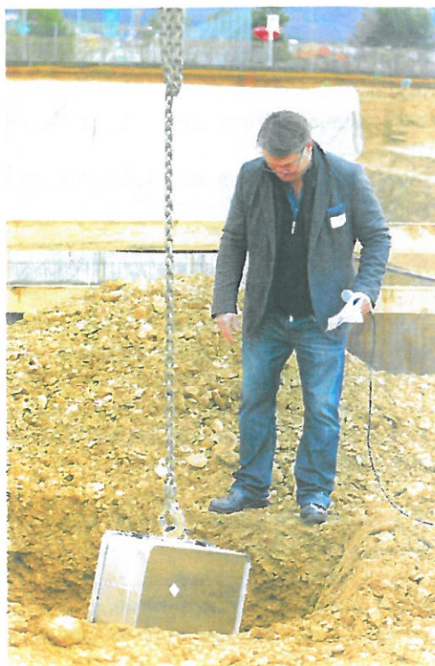
Präzise versenkt ein Kranführer den Metallkoffer in der vorgesehenen Erdgrube.