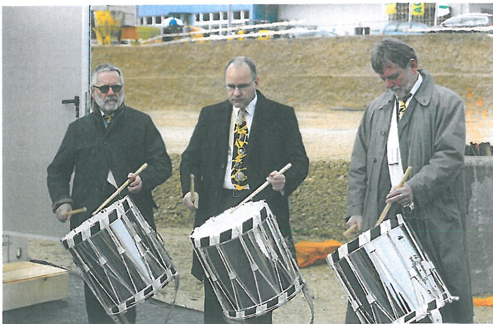
Die «Alti Garde» der Fasnachtsclique «Unverwieschtligi Schnooggekerzli» lässt während des Festaktes die Trommeln wirbeln.

fremdvermietet. Im August 2017 soll das neue Fachzentrum seinen Betrieb aufnehmen.