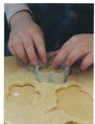
Milo platziert ganz vorsichtig die Guetzliförmchen..