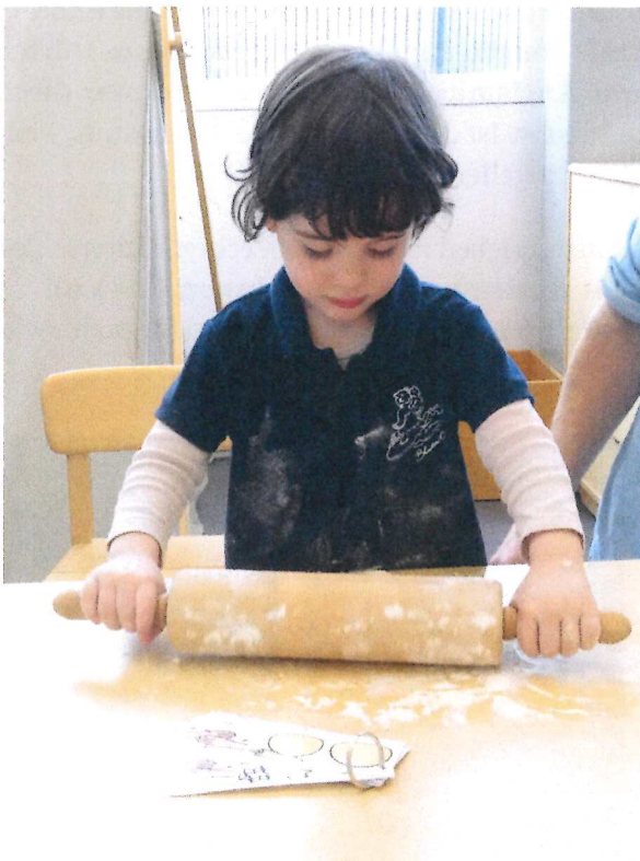
Can rollt sorgfältig den Teig aus...